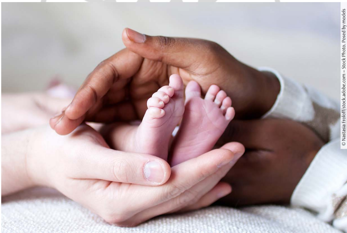
► Abb. 1 Im Wochenbett arbeiten Angehörige verschiedener Professionen zusammen, um die junge Familie bestmöglich zu unterstützen. Posed by models.

Die Fragestellung, in welcher Weise die Zusammenarbeit zwischen den Gesundheitsberufen verbessert werden sollte, gewinnt zunehmend sowohl national als auch international an Bedeutung. Darüber hinaus rückt die interprofessionelle Zusammenarbeit auch im Zusammenhang mit der Geburt zunehmend in den Fokus. Die Wochenbettbetreuung nimmt dabei eine besondere Rolle ein.